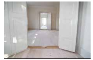
Hvid sæbe behandling

Husk at ryste dunken rigeligt inden brug.