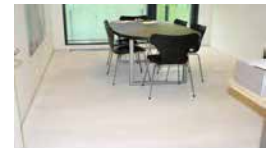
Hvid olie behandling

- Ønskes et gulv med en mere varm glød, udelades lud og der påføres naturolie.