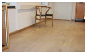
Hvid lak behandling

Ønskes der et meget lyst gulv, forbehandles det med Trip Trap lud, se under ludbehandling.