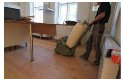
Slibning før overfladebehandling

Gulvet bør støvsuges inden ludbehandling.