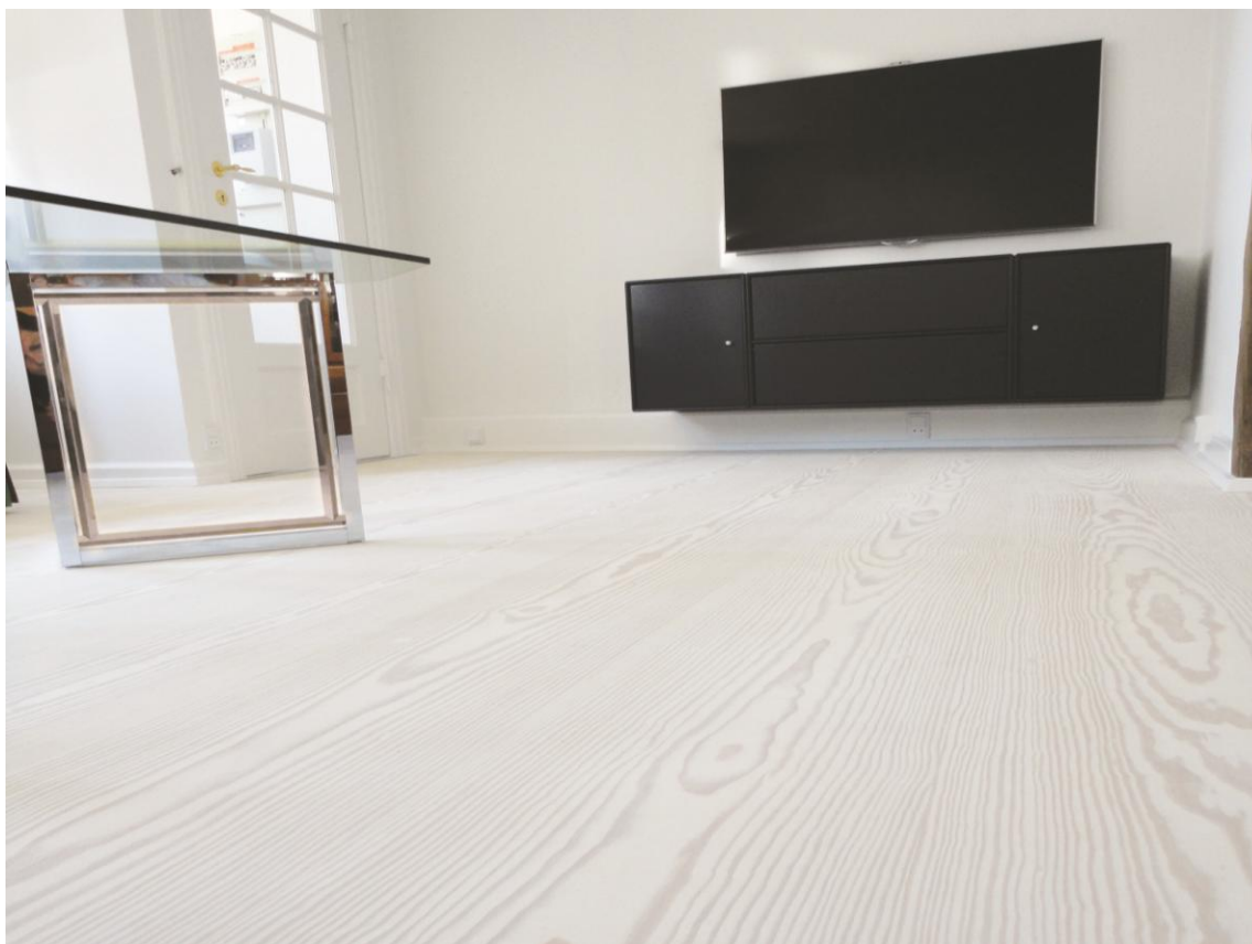
Pitch Pine Select