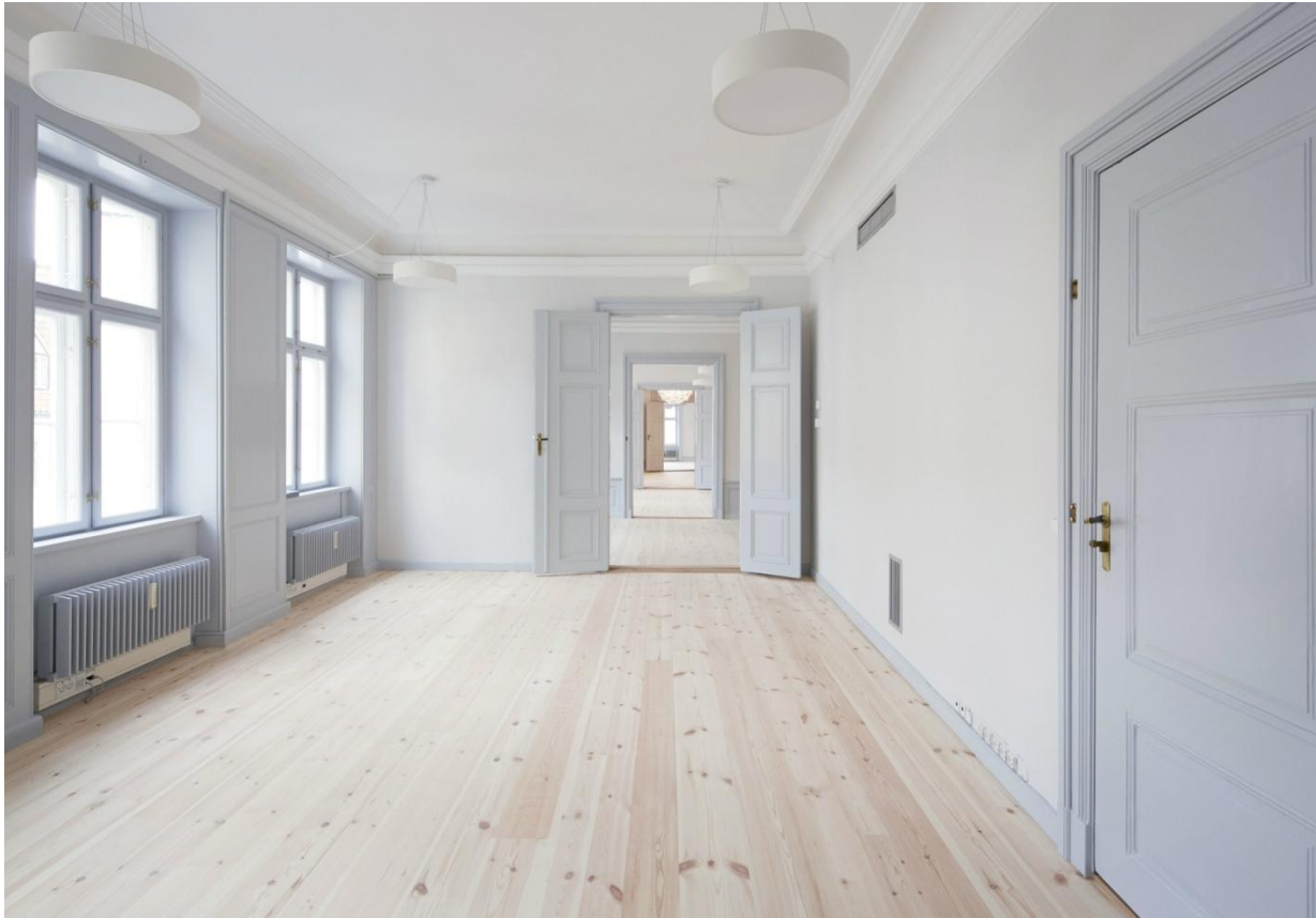
Russisk Fyr Natur