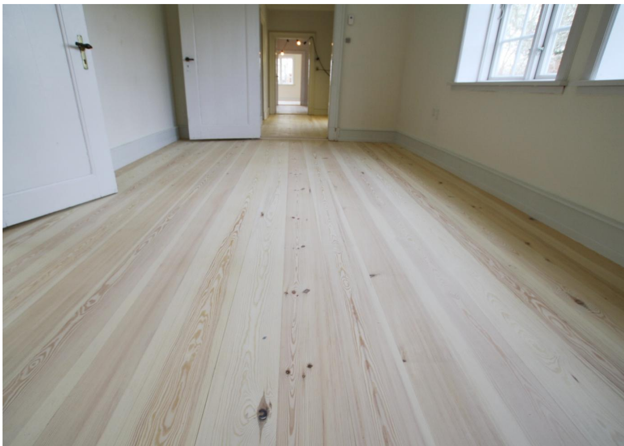
Pommersk Fyr Natur