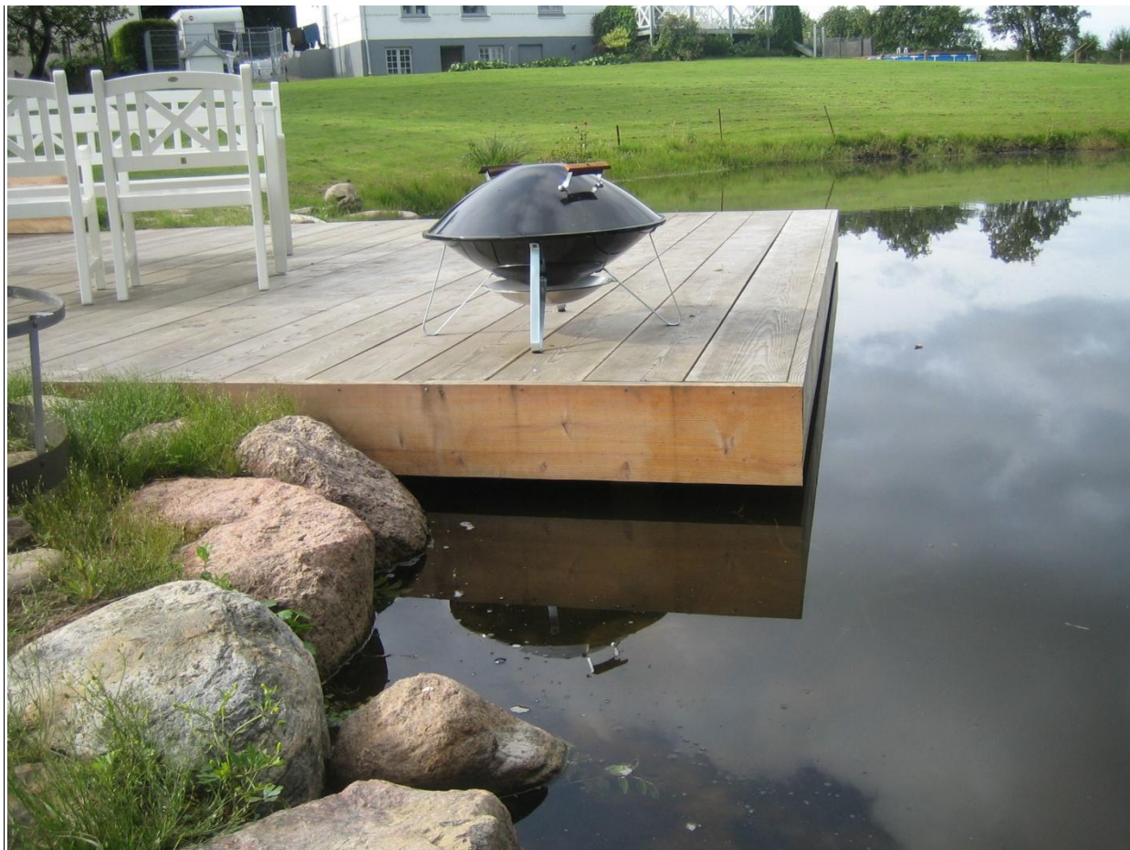
Douglas Natur Terrassebrædder