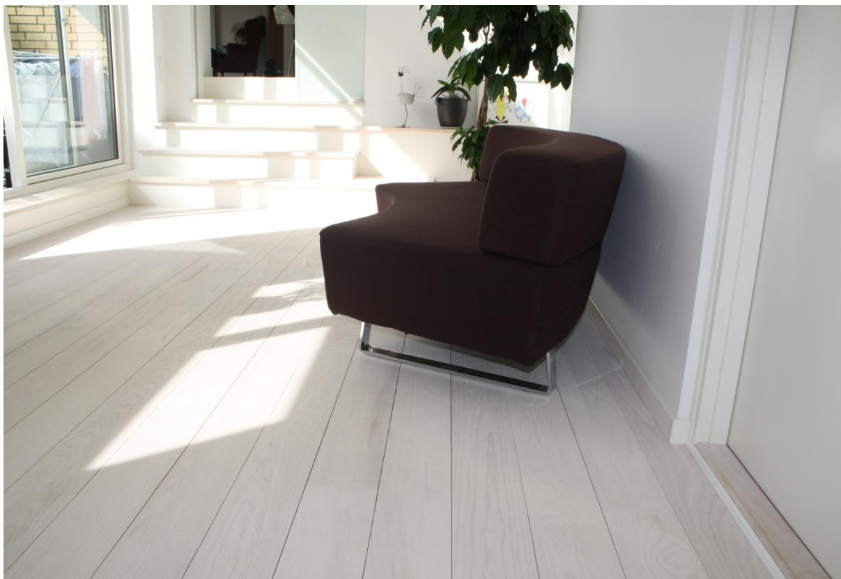
Dansk Ask Select Hvid