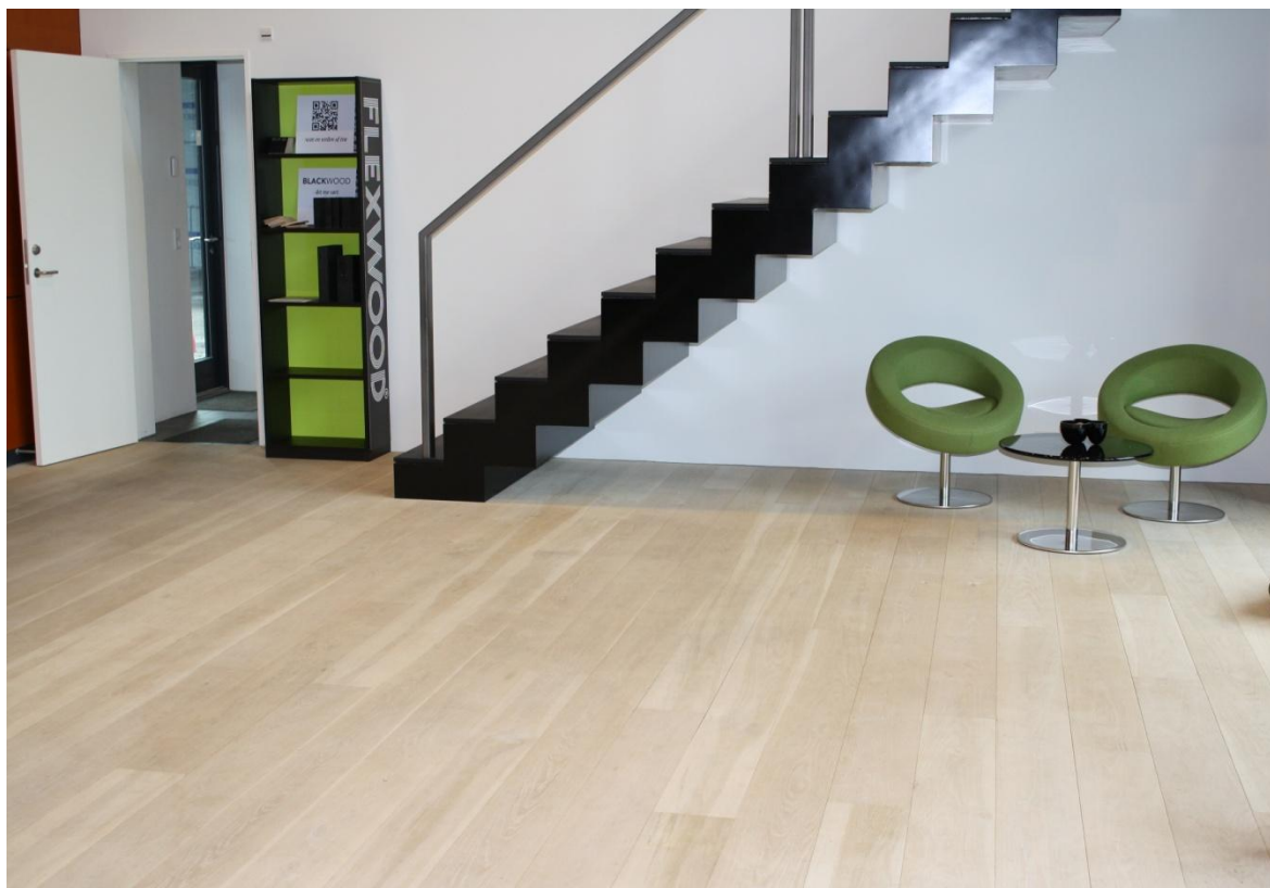
Amerikansk Hvid-eg Select