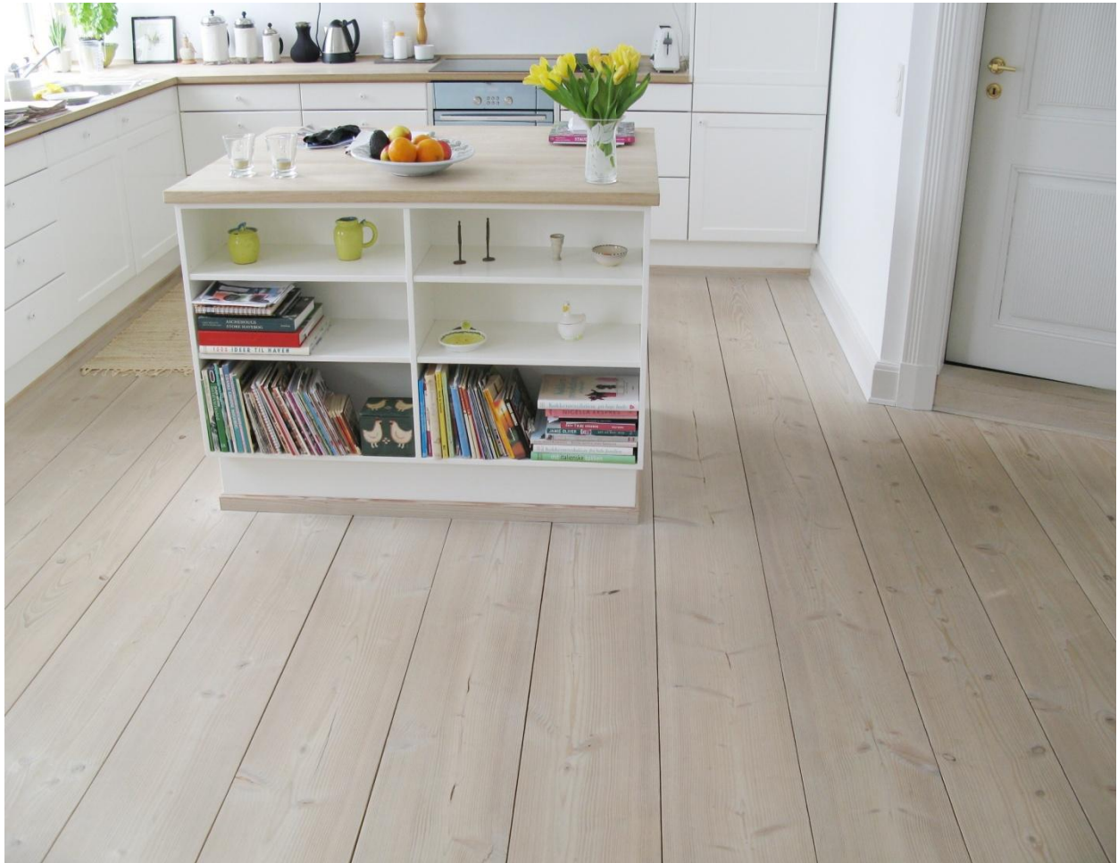
Dansk Douglas Natur