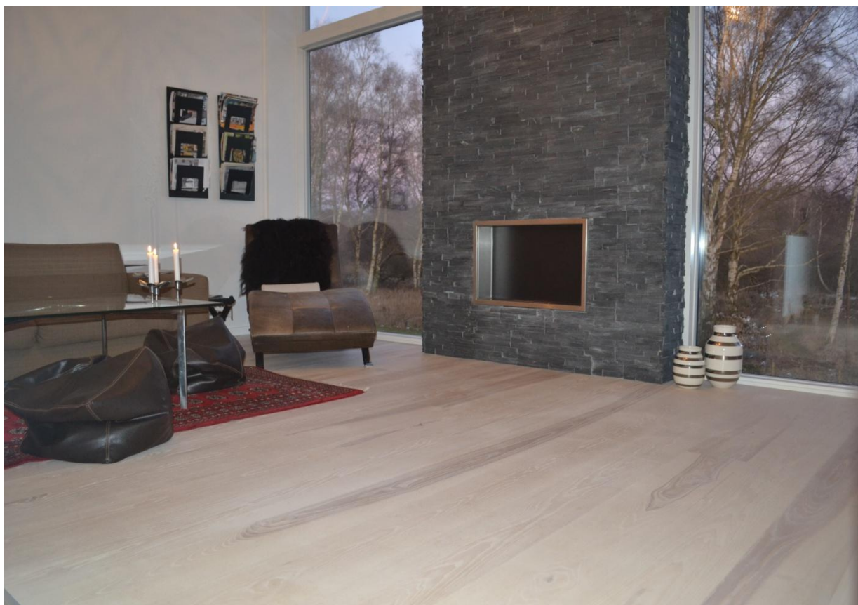
Dansk Ask Select