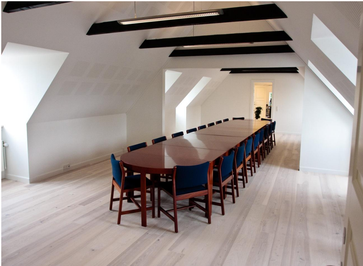
Dansk Ask Natur