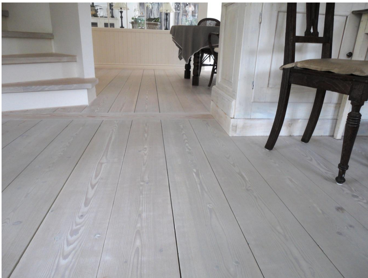
Amerikansk Douglas Natur